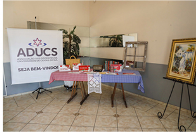
Almoço de Dia do Professor 2022