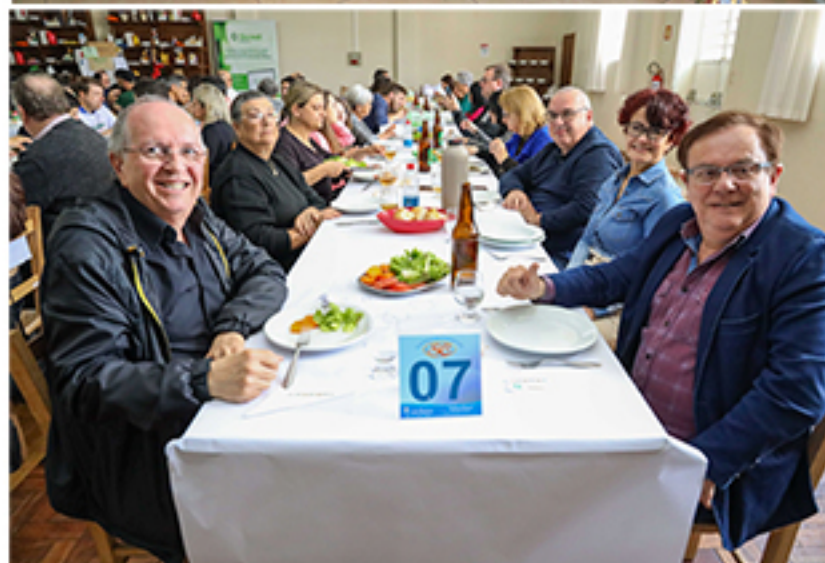
Presente de Dia do Professor (2021-2022)